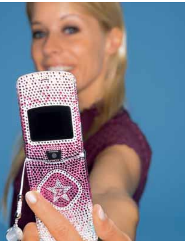
Glamourös: ein Handy, mit Glitzersteinen von Swarovski überzogen.

Das Mobiltelefon ist unser ständiger Begleiter. Viele möchten ihrem Lieblingsspielzeug deshalb eine persönliche Note geben. Kein Problem, wie ein Abstecher in die Welt des Handy-Tunings zeigt.